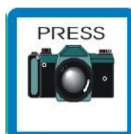
NOVINAR - FOTOGRAF